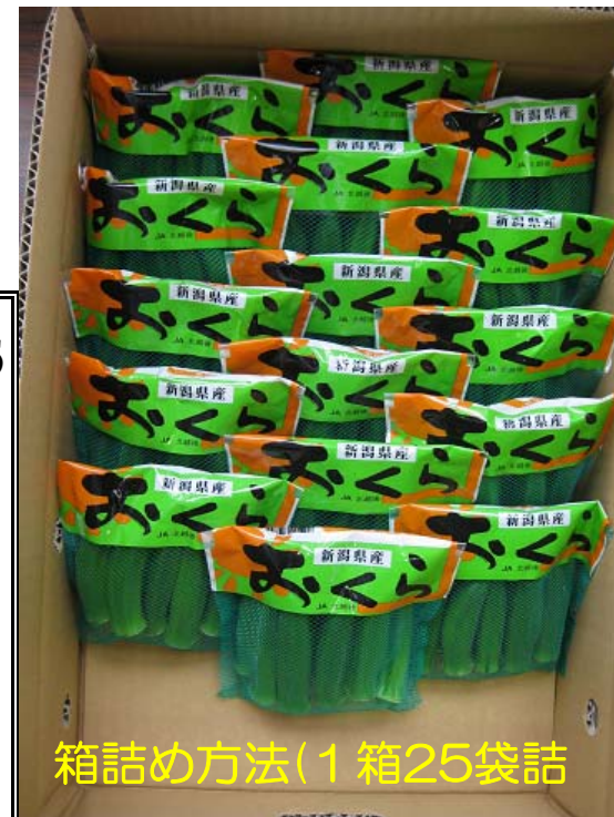
箱詰め方法(1箱25袋詰)